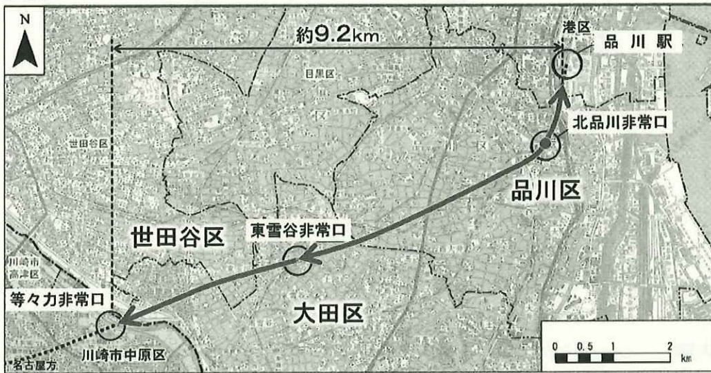
国土地理院発行の数値地図50000(地図画像)に中央新幹線計画路線等を追記